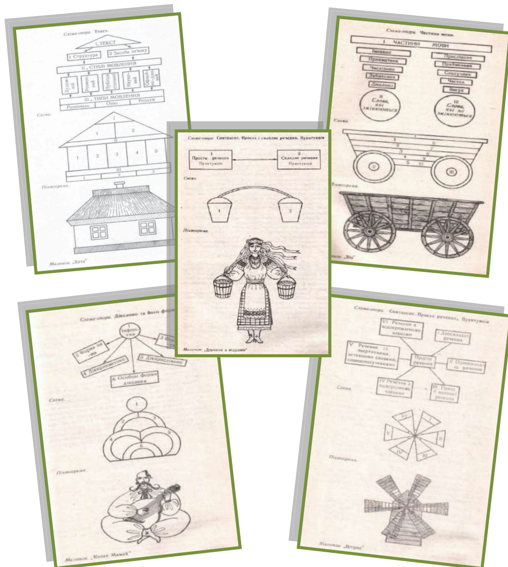
Рис. Схеми-опори Л. І. Забайти: схема, піктограма, малюнок подано за виданням (Забаита Л. І., 1991, с. 59, 91, 109, 125).

Схеми, піктограми, малюнки до однієї й тієї ж теми можуть бути різними. Це залежить від загального задуму всього сценарію чи за одним розділом (темою), чи за кількома. Наприклад, за темою «Текст. Стилі мовлення» було створено схему (модель) на основі поєднання трикутників, прямокутників, піктограму – у вигляді хати і малюнок «Хата». Дехто з учнів зробив піктограму, малюнок у вигляді храму, палацу, інші сприйняли зовсім в іншому об-