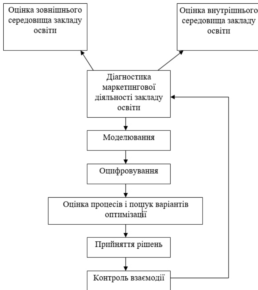
Рисунок 1. Модель процесу оцінювання ефективності маркетингової діяльності закладу освіти