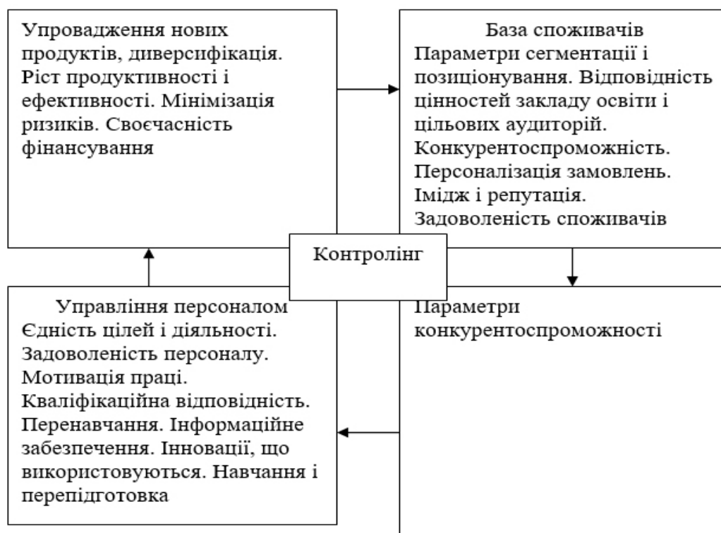
Рисунок 2. Компонента системи контролінгу закладу освіти