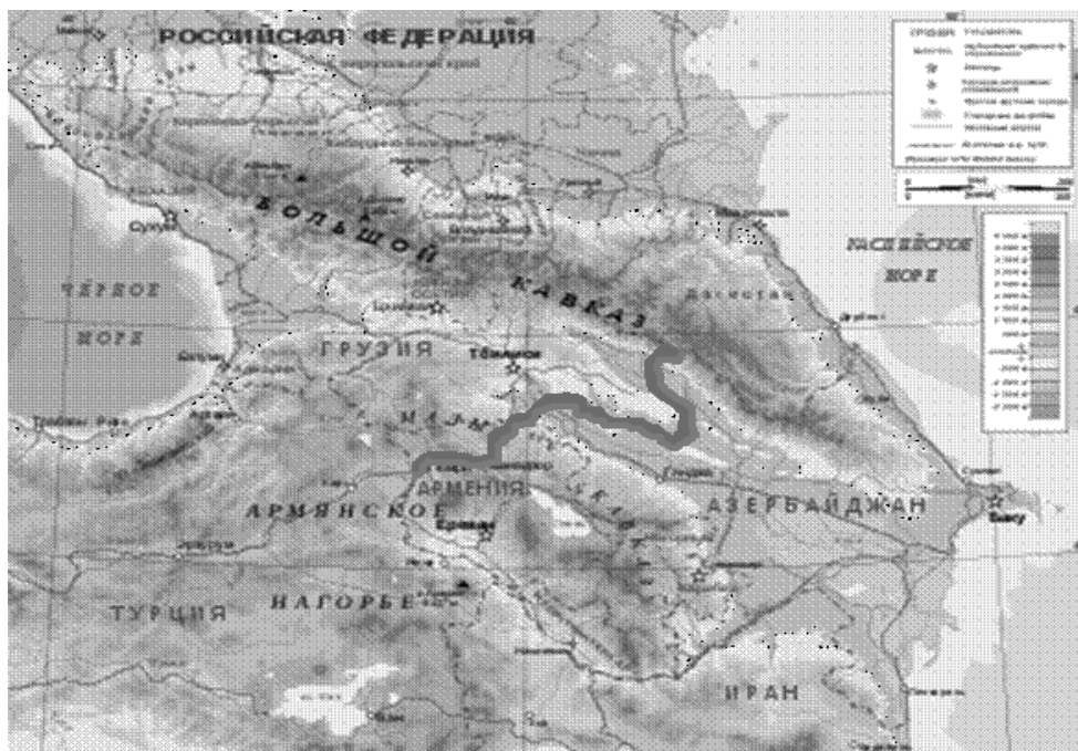
Рис. 3 Предполагаемая территория для апробации регионального механизма отслеживания и контроля болезней животных в Закавказье

С учетом ряда факторов, экспертами был предложен формат регионального сотрудничества, включающий 3 основных компонента: 1) пассивное отслеживание болезней (т.е. двухсторонний сбор и обмен информацией относительно эпизоотического статуса того или иного поголовья скота в случае его перемещения на территории приграничной зоны одной из республик); 2) активное отслеживание болезней (т.е. двухсторонний отбор и обмен результатами тестирования проб патологического материала в случае оповещения о клиническом проявлении или подозрении на заболевание среди поголовья скота во время его перемещения на территории приграничной зоны одной из республик); 3) совместное реагирование на риск распространения той или иной болезни (т.е. двухстороннее применение ветеринарно-санитарных ограничений и проведение комплекса противоэпизоотических мероприятий в случае лабораторного подтверждения того или иного заболевания на территории приграничной зоны одной из республик). Ответственность за выполнение вышеперечисленных компонентов предполагается распределить в следующем порядке: 1) частные ветеринарные врачи (ветеринарные фельдшеры), работающие на территории