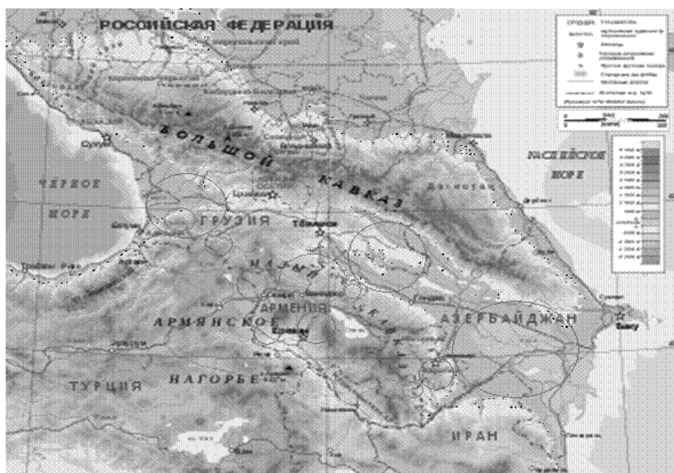
Рис. 1 Предполагаемые зоны повышенного эпизоотического риска в Закавказье