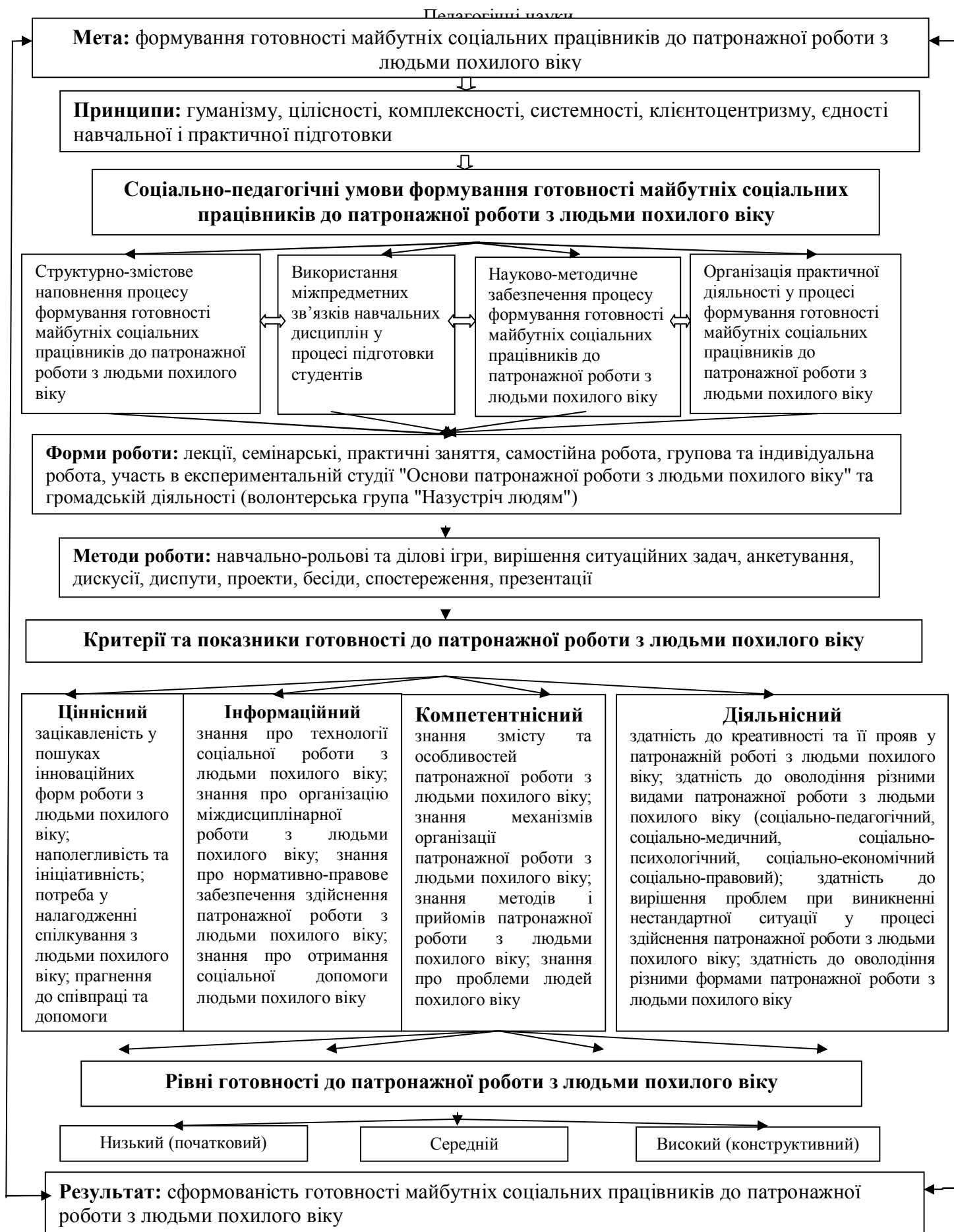
Рис. 1. Структурно-функціональна модель процесу формування готовності майбутніх соціальних працівників до патронажної роботи з людьми похилого віку