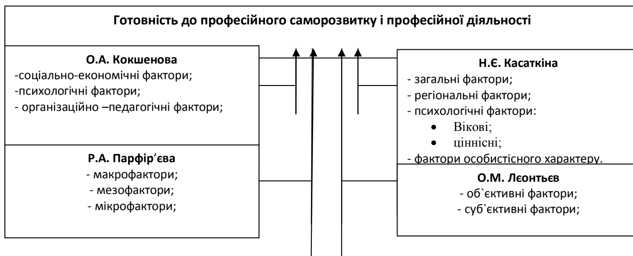
Рис. 2. Фактори, що впливають на формування готовності до професійного саморозвитку і майбутньої професійної діяльності

Також слід відзначити, що особливе значення у формуванні особистісного і професійного саморозвитку майбутнього педагога надається вивченню і обліку факторів, які впливають на цей процес. Під фактором розуміється умова, рушійна сила будь-якого процесу, явища; чинник, розуміється все те, що, так чи інакше, впливає на той чи той процес [4]. Наукові праці С. Вітвіцької, Н. Касаткіної, О. Леонтьєва, Р. Парфір'євої, О. Кокшенової, в яких досліджуються фактори, що впливають на самовизначення і розвиток особистості студента, дають можливість краще зрозуміти і простежити їх зв'язок із факторами, які впливають на формування готовності магістрантів до професійного саморозвитку і майбутньої професійної діяльності, адже вони є взаємозв'язаними і взаємозумовленими. На підставі аналізу наведених праць констатуємо різноманітний підхід авторів до групування факторів, що впливають на процес формування готовності магістрантів педагогічного профілю до професійного саморозвитку і майбутньої професійної діяльності (рис. 2).