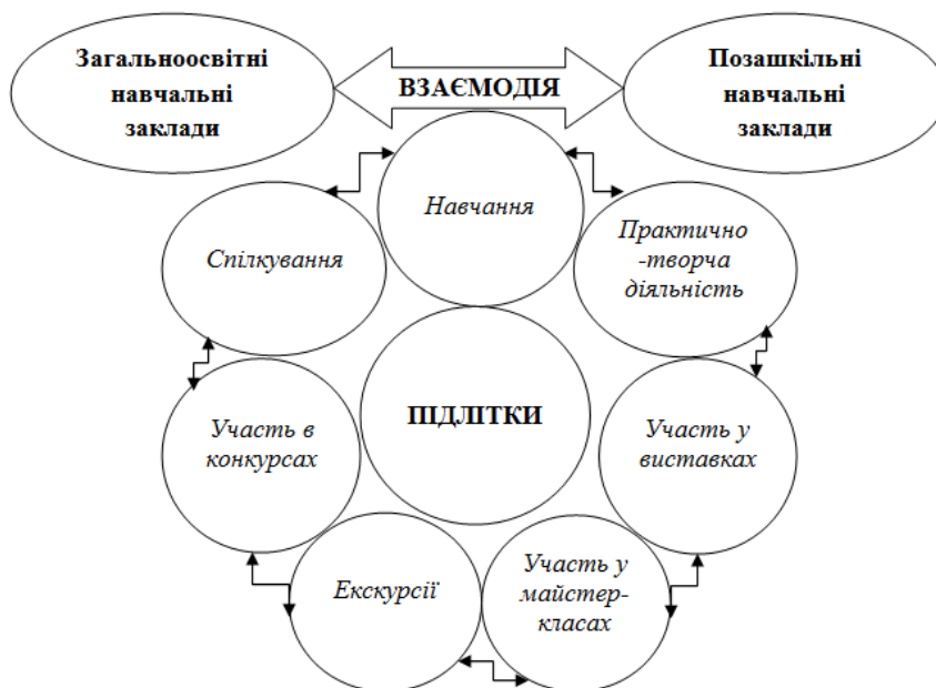
Рис. 2. Модель самореалізації творчих якостей підлітків

Реалізація багатовекторної моделі зумовила розроблення моделі самореалізації підлітків, розкриття творчих здібностей учнів та спрямованість їх до акмеусіху. Оскільки естетичне виховання підлітків відбувається у спілкуванні суб'єктів взаємодії, у ході інтеракції, ми побудували модель самореалізації творчих якостей підлітків у вигляді уявного телефону, адже телефон у житті людини є основним засобом комунікації (рис. 2).