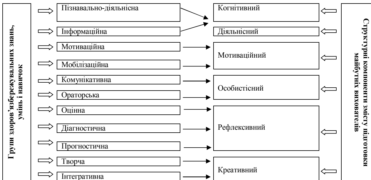
Рис. 2. Групи здоров'язбережувальних знань, умінь і навичок відповідно до структурних компонентів підготовки майбутніх вихователів до формування здоров'язбережувальної компетентності дошкільників засобами ігрової діяльності

Інтерполюючи зазначене вище на досліджуваній процес, нами визначено, що загальний обсяг здоров'язбережувальних знань, умінь і навичок, якими повинен оволодіти майбутній вихователь для ефективного формування здоров'язбережувальної компетентності дошкільників засобами ігрової діяльності, досить значний, і тому його доцільно класифікувати на декілька груп, схематично їх зображено на рис. 2. Зауважимо, що визначені групи сприятимуть реалізації змісту підготовки майбутніх вихователів у його структурних компонентах.