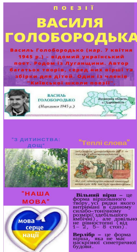
Рис. 5. Поезії Василя Голобородька

Висновки. Підготовка вчителя-філолога, здатного мотивувати учнів цифрової епохи до прочитання та аналізу художнього твору, є об'єктивною вимогою часу. Майбутній словесник повинен розуміти, з якими викликами йому доведеться зіткнутися під час виробничої практики в загальноосвітніх навчальних закладах та в подальшій професійній діяльності. Він має володіти сучасними технологіями опрацювання матеріалу і бути постійно готовим до опанування нових. Практика засвідчила, що значний потенціал для досягнення цієї мети має інфографіка. Вона дозволяє доступно, лаконічно, наочно та оперативно подати на уроці необхідну інформацію. Для формування у студентів умінь створювати інформаційну графіку та використовувати її в освітньому процесі потрібна систематична і планомірна робота на лекційних, практичних заняттях із методики викладання української літератури, у процесі самостійного опанування матеріалу, під час виконання курсових, випускних кваліфікаційних досліджень та проходження педагогічної практики.