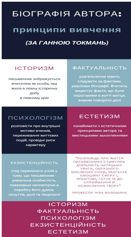
Рис. 1. Принципи вивчення біографії

української літератури (рис. 2). Завдяки поєднанню дизайну та інформації для сприйняття матеріалу, поданого за допомогою інфографіки, достатньо декількох хвилин.