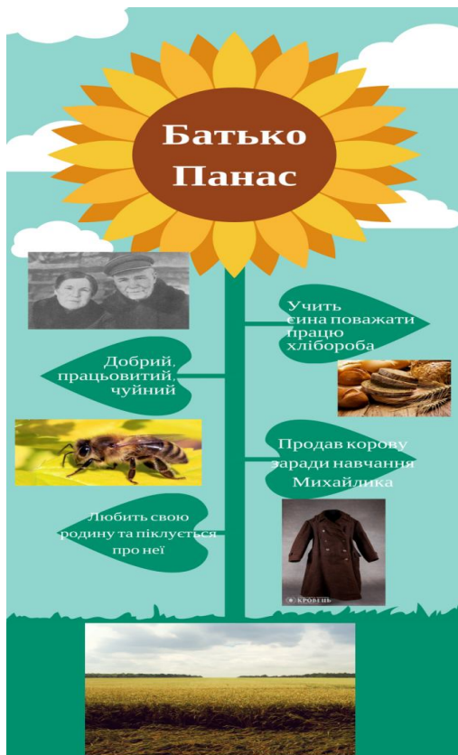
Рис. 4. Образ батька Михайлика

За допомогою цієї інфографіки (рис. 4) студентка-практикантка провела аналіз образу батька головного героя повісті Михайлика. Зокрема, школярам потрібно було знайти в тексті портретну характеристику цього персонажа, визначити риси його характеру та пояснити, чому батькову кирею Михайлик дуже любив. Студентка-третьокурсниця Ястреб Наталія у своїй курсовій роботі, присвяченій особливостям шкільного вивчення творів представника «Київської школи поезії» В. Голобородька, також подає розроблені нею до уроку української літератури у 8 класі зразки інфографіки, один із яких поданий вище (рис. 5).