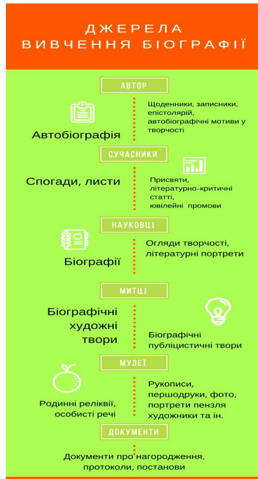
Рис. 2. Джерела вивчення біографії

Сучасні теоретики і практики мають різні погляди на те, які цілі, властивості й ознаки має інфографіка. Окремі науковці в царині теорії журналістики і дизайну вважають її різновидом ілюстрації, зокрема наголошують, що це карти, таблиці та схеми, а її мета полягає в наочному ілюструванні публікації. Частина фахівців розглядає інфографіку як повноправний засіб візуальної комунікації.