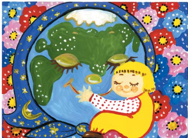
“Рідна, я так тебе люблю!” (Вдовиченко Богдан)