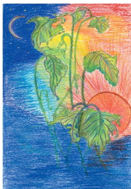
“Дім свободи” (Тімченко Аполлінарія)