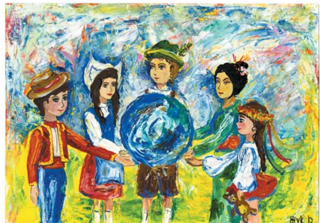
“Світ у наших руках” (Жук Дар’я)