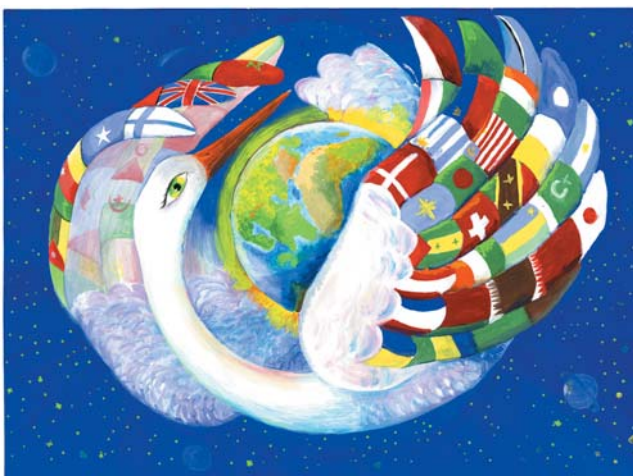
“Планету ніжно огортає все людство білими крильми...” (Мариніч Юлія)