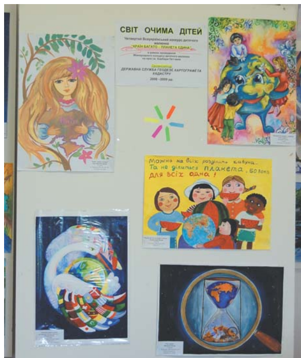
Один зі стендів виставки