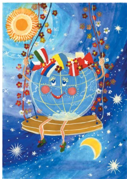
“Планета Світла і Добра” (Білевщук Катерина)