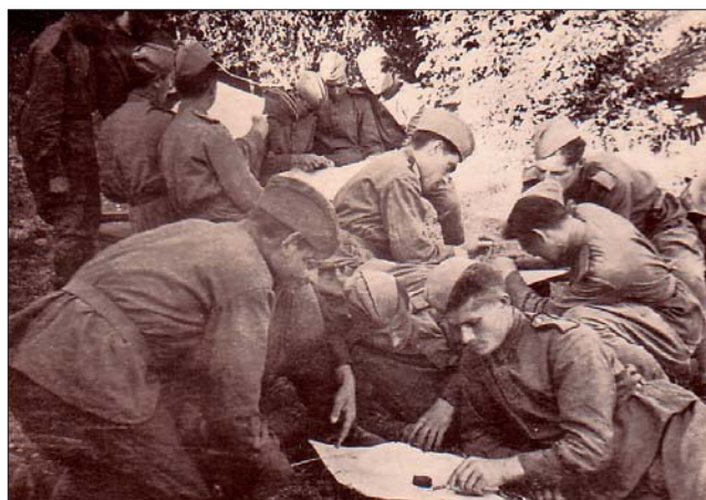
Заняття з військової топографії в Школі особливого призначення (1943-1944 рр.)