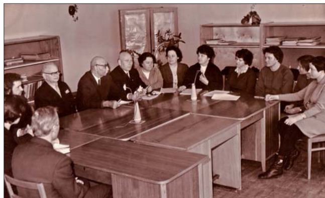
На засіданні кафедри (1974 р.)

тільки швидко адаптувався у великому колективі кафедри, але і став одним з найавторитетніших його співробітників. По суті, він був провідним фахівцем кафедри в галузі геодезії.