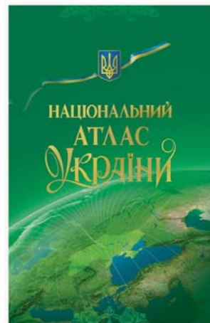
Мал. 3. Національний атлас України

Найвагомішим досягненням української географічної та картографічної науки і практики стало видання у 2007 р. Національного атласу України (мал. 3), створеного відповідно до Указу Президента України "Про Національний атлас України" (2001 р.) та Постанови Кабінету Міністрів України "Про затвердження Програми підготовки та видання Національного атласу України" (2003 р.).