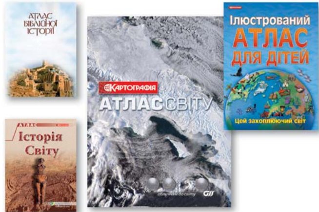
Мал. 2. Перекладні видання

тематичних атласів "Історія світу" (2008 р.), "Ілюстрований атлас для дітей" (2008 р.), "Глобальні проблеми світу" (2009 р.), "Атлас біблійної історії" (2010 р.), які донесли українському читачеві багато оригінальної інформації (мал. 2).