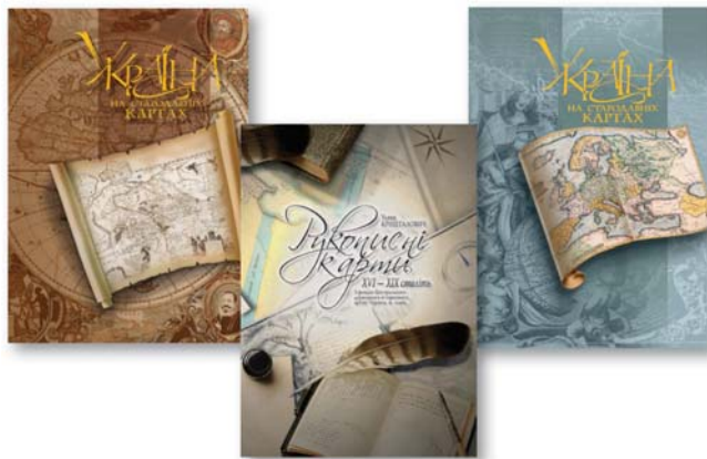
Мал. 9. Серія видань "Пам'ятки картографії України"

стала серія видань "Пам'ятки картографії України" . ДНВП "Картографія" видало три атласи репродукцій старовинних карт із картографічних фондів львівських бібліотек: Україна на стародавніх картах. Кінець XV – перша половина XVII ст. (2004, 2006 рр.), Україна на стародавніх картах. Середина XVII-друга половина XVIII ст. (2009 р.), Рукописні карти XVI-XIX століть (2011 р.) (мал. 9).