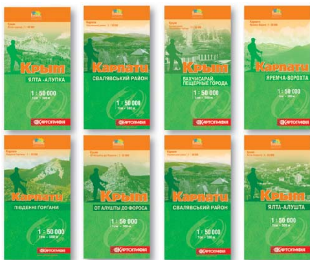
Мал. 6. Маршрутні туристичні карти Українських Карпат і Криму масштабів 1:50 000-1:75 000

З рубежу століть туристичні картографічні видання починають займати гідне місце і в асортименті продукції ДНВП "Картографія". 2001-го року виходить у світ туристична карта України масштабу 1:1 000 000, пізніше – туристичні карти України масштабу 1:1 250 000 (українською та російською мовами, 2002 р.), оглядові туристичні карти Криму (з 2002 р.) та Українських Карпат (з 2006 р.) масштабу 1:300 000. Виданням карти "Карпати. Яремча-Ворохта" (2005 р.) масштабу 1:50 000 започатковано серію великомасштабних (1:50 000 та 1:75 000) маршрутних туристичних карт на регіон Українських Карпат, а вихід карти "Крым. Чатыр-Даг" масштабу 1:50 000 поклав початок аналогічній серії на регіон Криму. Карти наочно відтворюють пішохідні туристичні маршрути, гірськолижні витяги, об'єкти обслуговування туристів, визначні місця та екзотичні об'єкти. На сьогодні уже вийшло друком понад 40 найменувань цієї серії (мал. 6). 2008-го року відновлено серію оглядових туристичних карт адміністративних областей України (масштаби 1:250 000-1:400 000) – видано 8 карт (не рахуючи карти Криму).