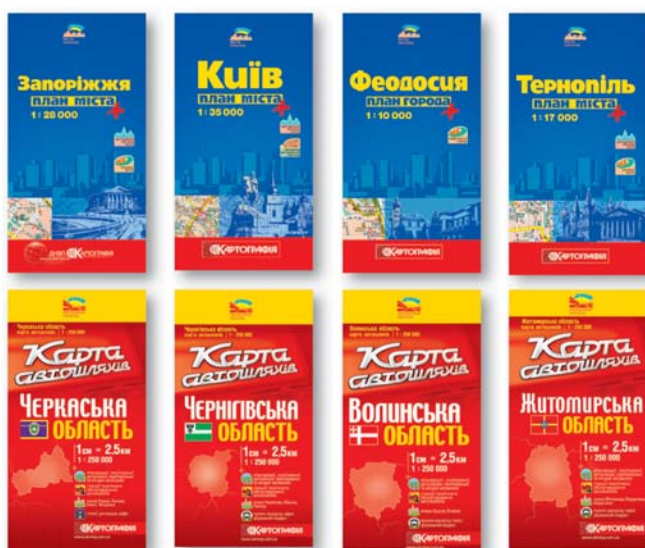
Мал. 7. Плани міст із серії "Міста України" та обласні карти автошляхів масштабу 1:250 000

Картографування міст. Атласи та плани міст посідають важливе місце серед видань, що адресовані широким верствам населення. Виданням у 1993 р. плану Києва масштабу 1:25 000 ДНВП "Картографія" започаткувало серію видань "Міста України" , підходи до створення якої було відкореговано у 1998 р.: розроблено єдині вимоги до укладання географічної основи та відбору тематичного навантаження, стандартизовано умовні позначення, шрифтове та кольорове оформлення. Плани міст доповнюються картами околиць і, як правило, центральної частини міста у збільшеному масштабі. Плани окремих міст з 2004 р. почали виходити іноземними мовами. Нині серія включає понад 90 планів майже на 70 міст України (мал. 7). Для створення картографічної основи міст широко використовуються космічні знімки.