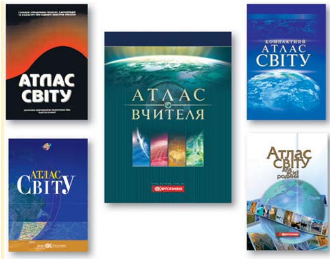
Мал. 1. Атласи світу

До проголошення незалежності України вітчизняні картографічні підприємства не видавали довідкових атласів світу. Тому знаковою подією став вихід у світ у 1999 р. Атласу світу (ДНВП "Картографія"), який підсумував велику роботу з передачі українською мовою географічних назв зарубіжних країн (обсяг 216 с., близько 30 тис. назв географічних об'єктів). З 2002 р., коли цей атлас було переукладено із незначними змінами за комп'ютерними технологіями, він уже витримав чотири перевидання (мал. 1).