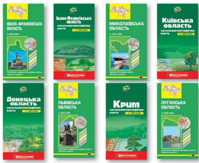
Мал. 5. Адміністративні та загальногеографічні карти областей України масштабу 1:250 000

2002 р. виданням карти Івано-Франківської області започатковано випуск нової серії адміністративних карт Автономної Республіки Крим і областей України масштабу 1:250 000 (мал. 5). Ці