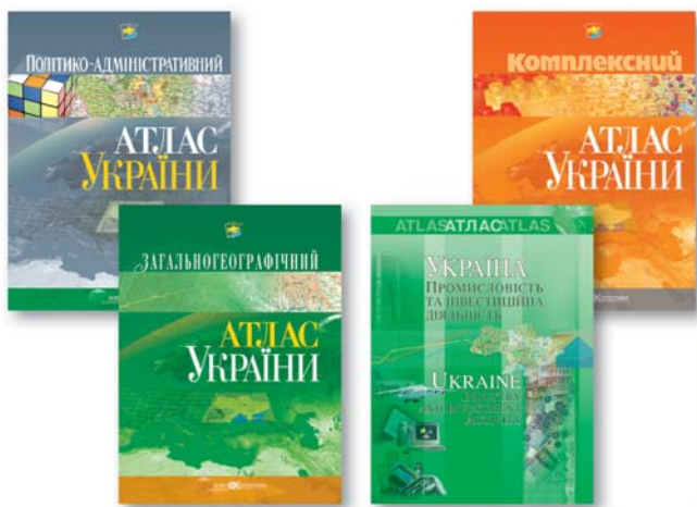
Мал. 4. Атласи України

Свідченням зрілості картографічної галузі став вихід у світ протягом короткого часу (2003-2006 рр.) низки довідкових атласів України, що видані ДНВП "Картографія" в однаковому форматі у твердій оправі: Загальногеографічний атлас України (2004 р.), Комплексний атлас України (2005 р.), Політико-адміністративний атлас України (2006 р.), а також "Україна. Промисловість та інвестиційна діяльність" (2003 р.) (мал. 4). Із пізніших видань відзначаємо Комплексний атлас Київської області (2009 р.).