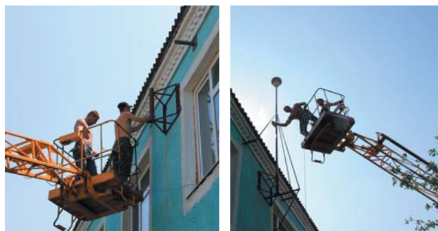
Мал. 2. Процес монтування опори

Опору виготовлено з металевих труб діаметра 50 та 60 мм, які з'єднані між собою способом "труба у трубі" 25 мм гвинтами та зварені. Нижню частину опори приварено до металевого каркасу, який закріплено на стіні будівлі 4-ма наскрізними анкерними болтами.