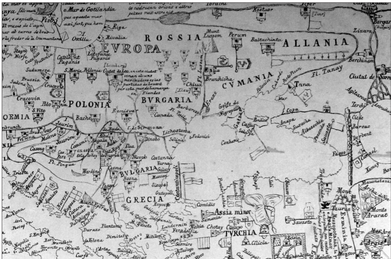
Мал. 1. Фрагмент берлінської копії третього-четвертого аркуша Каталонського атласу [14]