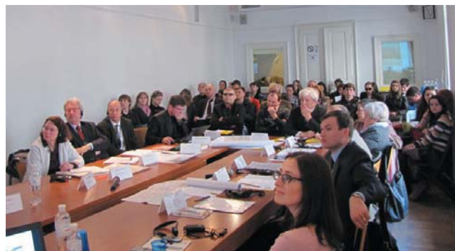
Робочий момент конференції 17 квітня 2013 р.

Перший – текстовий – це збірка з понад десяти нарисів українською та англійською мовами, які розкриють просторовий розвиток міста, починаючи з V ст. До цього розділу також увійдуть опис опублікованих планів міста й вибрана бібліографія.