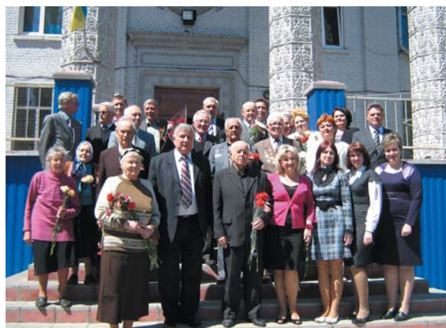
Зустріч колективу коледжу з ветеранами ВВВ і праці, 2011 р.