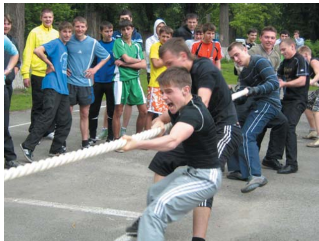
Студентські спортивні змагання