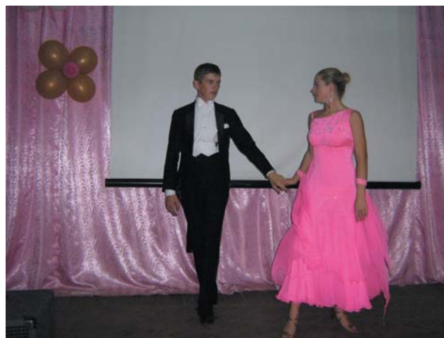
Бальний танець виконують випускники

Наш коледж – своєрідний оберіг: добрий дім для студентів і викладачів. Проблеми, умови проживання, поведінка, вміння спілкуватися і жити в одному колективі, навчання, дозвілля студентів завжди в полі зору вихователів-педагогів.