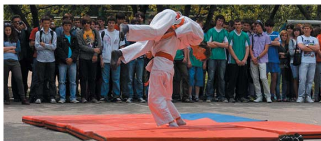
Показові виступи студентів-борців на "День здоров'я"

студентів є спортсмени – майстри і кандидати в майстри спорту.