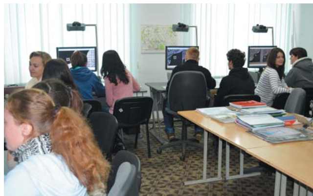
Заняття в аудиторії на ЦФС "Дельта"

Реагуючи на виклики часу, стрімкий розвиток новітніх технологій, невпинно оновлюється матеріально-технічна база, відкриваються комп'ютерні класи, закуповуються фотограмметрична та геодезична техніка (ЦФС "Дельта", базовий GPS і GPS-приймач, електронний тахеометр), розпочинається ремонт гуртожитку та навчальних аудиторій.