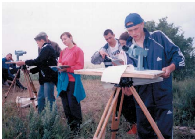
Студенти на практиці в с. Синява