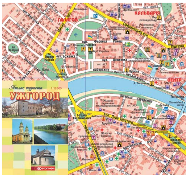
Мал. 3. Туристичний атлас Ужгорода (обкладинка та фрагмент карти)

У підприємстві побачили світ такі туристичні атласи міст: Києва (редактори Р. М. Галдецька, Л. В. Марченко), Одеси (редактор В. О. Прокоп'єва), Севастополя (редактор Г. М. Кошова), Чернігова (редактори Л. П. Біла, В. М. Соколова), Ужгорода (редактор Р. М. Галдецька) (мал. 3). Готуються до видання атласи Кам'янця-Подільського (редактор