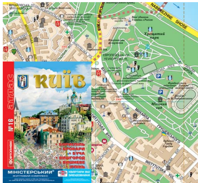
Мал. 2. Обкладинка та фрагмент карти з атласу Києва

Доповнює атлас довідкова текстова частина, де подано покажчик вулиць, а також назви органів