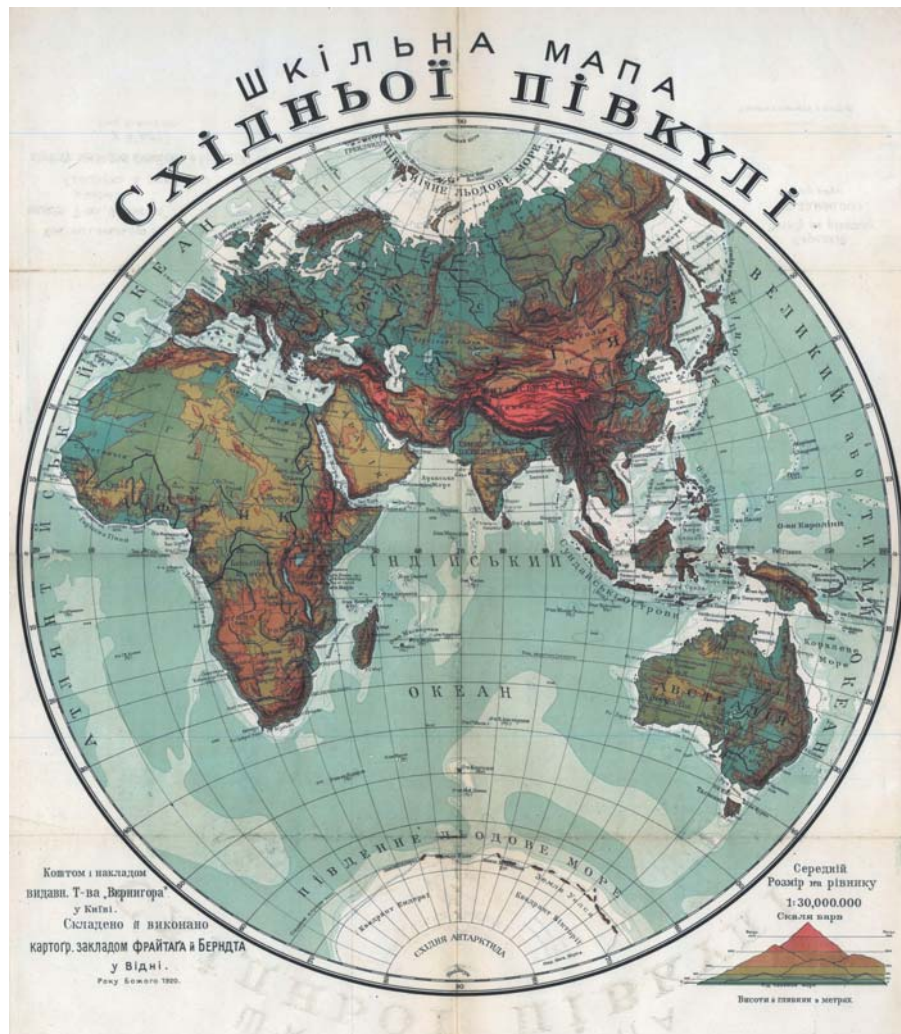
Мал. 1. Шкільна карта Східної півкулі С. Рудницького

Майже всі карти виконані у масштабі 1:10 000 000, Європи – 1:5 000 000, карти півкуль – 1:30 000 000. Це фізичні карти. На них зображено та підписано форми рельєфу. Номенклатуру позначено у відповідності із особливостями української термінології. Цікавими є назви: рівник (екватор), Зворотник Ракка (Пн. тропік), Зворотник Козорога (Пд. тропік), бігун (полюс) тощо. Берегову лінію чітко виділено, позначено океани, моря, затоки, протоки, острови та півострови. Всі елементи берегової лінії нанесено дуже докладно, до найменших островів та заток. Глибини подано з інтервалом 0-200-1000-2000-3000-5000 м і більше та пошаровим зафарбуванням. Підписано: Великий або Тихий океан, Атлантийський океан, Індійський океан, Північне Льодове море, Південне Льодове море, Східня Антарктида (на мапі Східної півкулі) тощо; Червоне море, Гвінейська затока, Мосамбіцький канал (протока), затока Еден, протока Баб-ель-Мандеб, острови: Мадагаскар, Занзібар та інші (Африка); Грейт Берріер Ріф (Великий Бар'єрний риф), Коралеве море, море Тасмана, затока Карпентерія, Нова