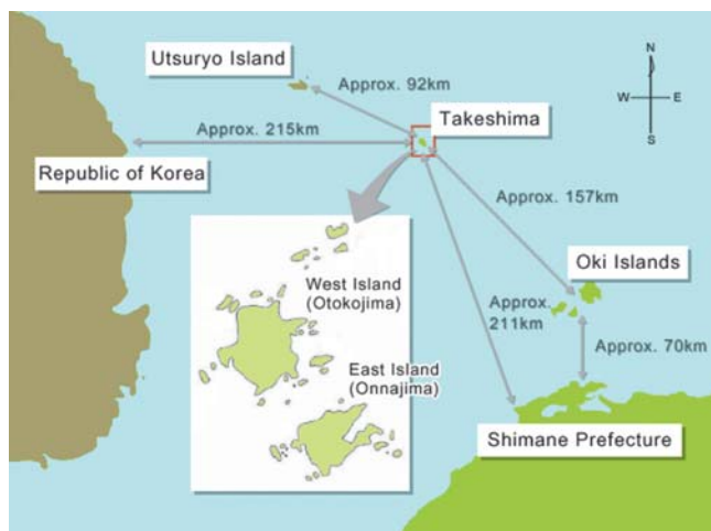
Мал. 2. Карта з офіційного сайту Міністерства закордонних справ Японії ( http://www.mofa.go.jp/region/asia-paci/takeshima/ )

Важливо те, що острови визнані архіпелагом, а не поодиноким морською скелею, бо, згідно з міжнародним правом, поодиноким скеля, розташована в морі на великій відстані від суходолу, може вважатися нічийною територією. Цікава карта розміщена на офіційному сайті МЗС Японії, на якій відстань до материкової частини Кореї більша, ніж відстань до острова Хонсю (мал. 2).