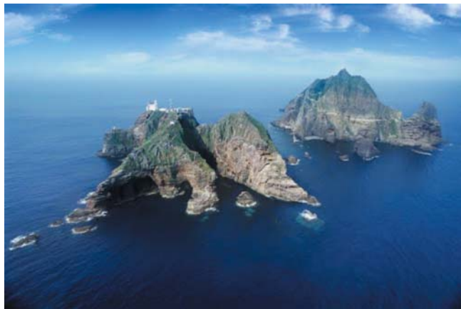
Мал. 1. Загальний вигляд архіпелагу Докдо

Острови не мають постійного населення. Тут розміщено південнокорейське поліцейське відділення, південнокорейська адміністрація острова та невеликий персонал, що обслуговує південнокорейський маяк.