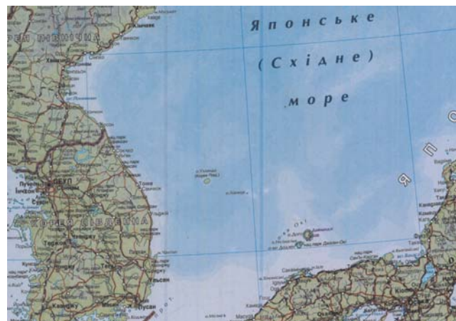
Мал. 7. Фрагмент карти з Атласу світу (вид. 2005 р.)

Китай, Франція, Велика Британія, Німеччина, Монголія визнають належність цих островів Республіці Корея. Навіть непримиренний ідеологічний ворог, якою є для країни Північна Корея, в питанні острова Докдо повністю поділяє позицію Республіки Корея і навіть погрожує "будь-якими засобами зупинити агресію японських мілітаристів та обіцяє військову допомогу співвітчизникам на півдні Кореї для захисту її території".