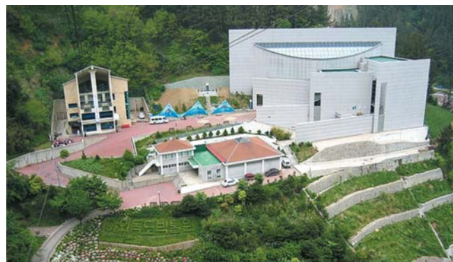
■ Dokdo museum seen from Dokdo observation tower on Mang hyang peak

У 1995 р. на острові Улліндо до 50-річчя визволення Республіки Корея було відкрито Музей Докдо ( http://www.dokdomuseum.go.kr ), в трьох залах якого представлено документальні й картографічні матеріали, як корейські, так і японські, які свідчать про належність острова до Кореї (мал. 3).