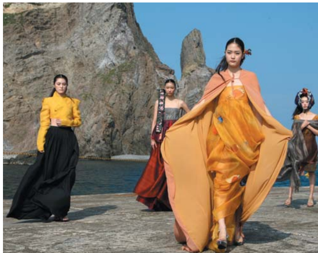
Мал. 5. Костюмоване шоу на Докдо в 2013 р.