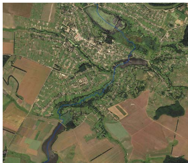
Мал. 2. Зображення ділянки місцевості в басейні р. Рось: ліворуч – на топографічній карті масштабу 1 : 100 000, праворуч – на космічному знімку

Отримані дані SRTM з точністю розрізнення 90 м було додатково опрацьовано, що дало можливість одержати поверхню з просторовим розрізненням 30 м. Окрім того, для підвищення точності ЦМР було враховано стокову структуру поверхні басейнів водозбору і топологію водотоків. Це дало змогу