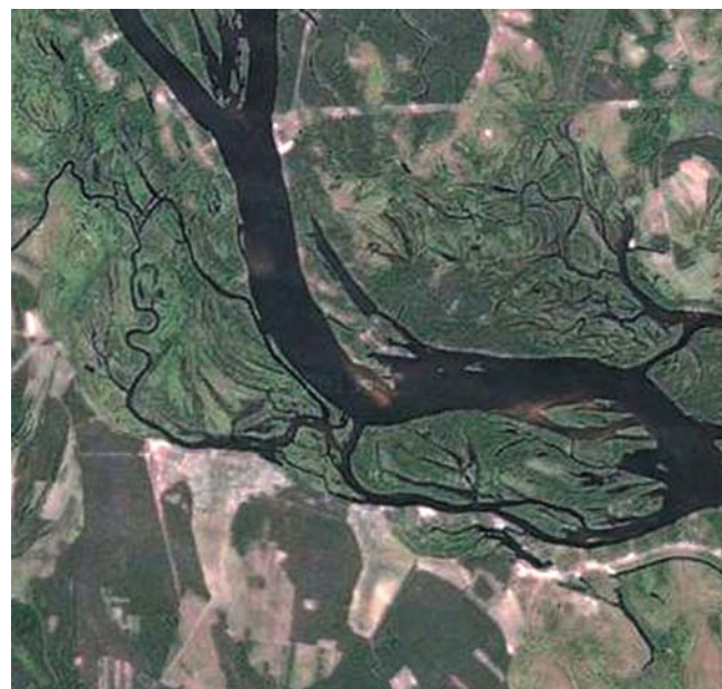
Мал. 1. Розташування гирла Росі за різними джерелами: ліворуч – Landsat 1 MSS (знімок від 27.02.1974 р.); праворуч – космічний знімок Spot Image (04.11.2009 р.)