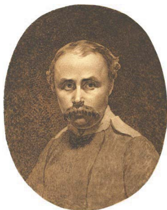
Мал. 1. Т. Г. Шевченко. Автопортрет (1849 р.)

The article describes the participation of the great Ukrainian poet and artist Taras Shevchenko (*1814-†1861) in the Aral descriptive expedition and Karatau geological expedition. For the first time the methods and devices for astronomical observations which were used in the Aral expedition are defined. Contacts of the poet with astronomers and geodesists are noted. An attempt was made to interpret some his watercolor paintings and drawings in a new light and find out the influence of astronomical and geodetic knowledge on his work.