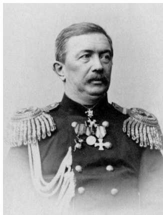
Мал. 2. Контр-адмірал Алексей Бутаков. Фото: Г. Й. Деньер (1865 р.)

Перебуваючи на засланні (23.06.1847-02.08.1857 рр.) як солдат 5-го, а з 08.05.1848 р. – 4-го Оренбурзького лінійного батальйону, Т. Г. Шевченко брав участь як художник в Аральській описовій експедиції (11.05.1848-31.10.1849 рр.), якою керував відомий російський мореплавець і гідрограф, учасник кругосвітнього плавання на військово-