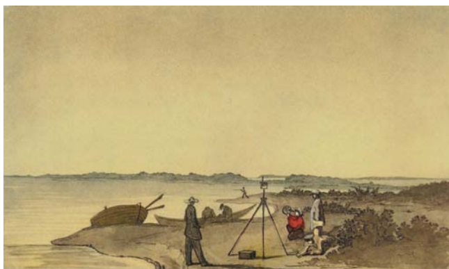
Мал. 5. Т. Г. Шевченко серед учасників експедиції на березі Аральського моря. Папір, акварель (12-21.ІХ.1848 р.)

поетичні та прозові твори і листи, виконав з науковою метою кілька сот мистецьких творів. Хронологічно його малярські твори цього періоду поділяють на п'ять груп: твори сухопутного переходу від Орської фортеці до укріплення Раїм (травень-червень 1848 р.); першого плавання по Аральському морю на шхуні "Константін" (липень-вересень 1848 р.); зимівлі на острові Косарал та в укріпленні Раїм (жовтень 1848 р. – травень 1849 р.); другого плавання по Аральському морю (травень-вересень 1849 р.) і твори, закінчені після повернення поета з експедиції в Оренбург [9, 10, 25, 27, 28].