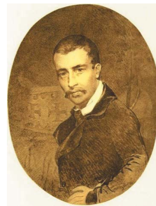
Мал. 4. Т. Г. Шевченко. Томаш Вернер (1849 р.)