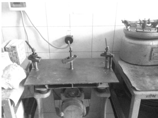
Рис. 1. Лабораторний вібростіл

Для формування зразків використовували стандартні металеві форми на три балочки розмірами 4×4×16 см. Ущільнення проводилось на лабораторному вібростолі, на якому було розташовано дві форми (рис. 1).