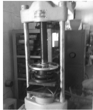
Рис. 2. Прес П–10

Випробування балок на міцність при згині виконувалось на пресі П–10 (рис. 2).