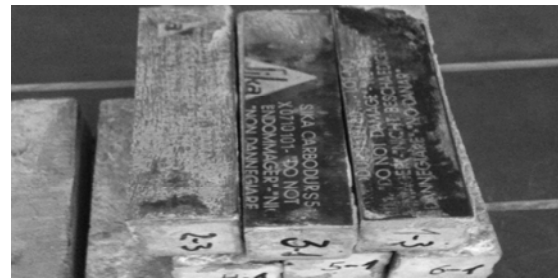
Рис. 6. Зразки з наклеєною вуглецевою стрічкою

Виконали приклеювання вуглецевої стрічки до бетонного зразка (рис. 6).