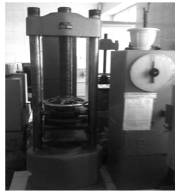
Рис. 3. Прес ПСУ–50

Випробування половинок балок, для визначення міцності бетону, виконувалось на пресі ПСУ–50 (рис. 3).