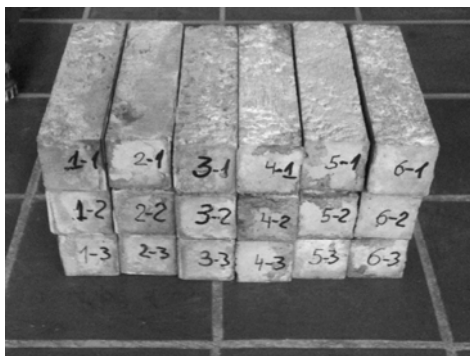
Рис. 5. Бетонні зразки

Зразки пропарювались у пропарочній камері протягом 2 годин за температури 80 °С (рис. 5).