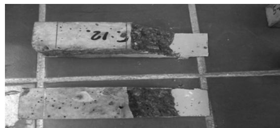
Рис. 8. Зруйновані підсилені зразки після 55 циклів випробування.

Після проведення 55 циклів останні вісім зразків було випробувано на міцність (рис. 8).