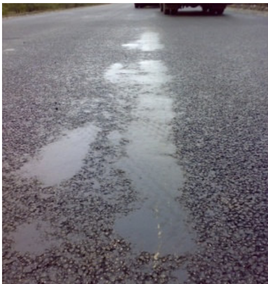
Рис. 1. Стан покриття із ЩМАС при розшаруванні суміші

Для запобігання розшаруванню ЩМАС за складом додають спеціальні структуруючі (стабілізуючі) добавки, які утримують гарячий бітум на поверхні зерен мінерального матеріалу під час їх проміжного зберігання і транспортування, що дозволяє підвищити товщину плівок в'язучого. Ефективність застосування стабілізуючих добавок оцінюють на основі зарубіжного досвіду і методів ви-