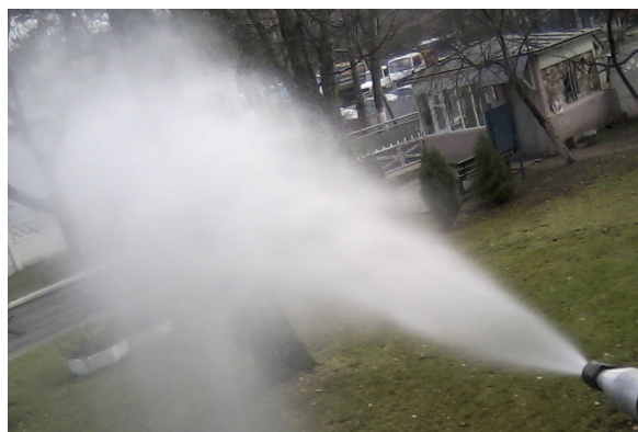
Рис. 2. Форма струи с максимальным углом распыления ( d_n = 1,8 мм, p \geq 12 МПа)

Общий вид опытного образца брандспойта и адаптеров к нему представлен на рис. 3.