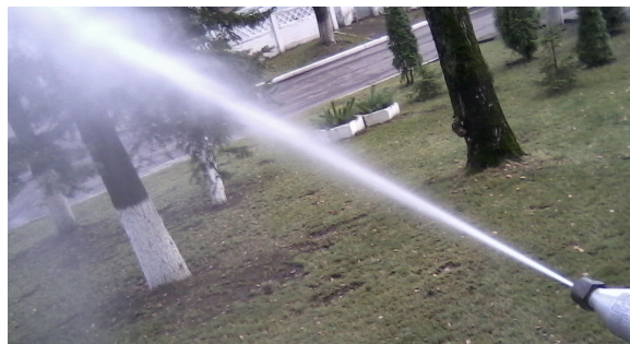
Рис. 1. Форма струи с минимальным углом распыления ( d_n = 1,8 мм, p \geq 12 МПа)

спойта с конически сходящимся насадком диаметром менее 1,8 мм позволил получать струю с диапазоном угла распыления от минимального (рис. 1) до максимального, представленного на рис. 2. Регулирование угла распыления плавное и обеспечивается рукояткой управления с малым углом поворота. Такая технологическая возможность брандспойта позволяет эффективно проводить мойку крупногабаритной сельскохозяйственной, строительной и военной техники с высокой степенью загрязненности поверхностей.