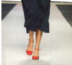
Каравай І. Модель з колекції осінь-зима 2005–2006 рр. Репродукція / Фото оргкомітету «Сезонів моди» // Viva. – К., 2005, 20 октября. – № 21. – С. 72.

На колекцію «Осінні коди» (осінь-зима 2000–2001 рр.) дизайнера надихнула рекламна кампанія в українських ЗМІ, присвячена введенню обов'язкового штрихкодуювання товарів. Ідею підкреслювала простібана й утеплена тканина для екстремальних умов – болонья, що домінувала в жіночих сукнях, комбінезонах, хустинах, елегантних чоловічих костюмах. Під враженням від мандрівки до Африки дизайнер створює колекцію «Мама Африка». «Завдяки своєму творчому відчуттю він зумів вдало вловити дух і саму концепцію поняття африканського ренесансу та втілити їх у своїй чудовій колекції», – так про цю роботу висловився посол ПАР в Україні Д. ван Тендера [1].