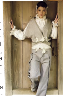
Даць О. Модель з колекції «Евіан», 2006 р.

кором – вишивкою і плетінням. «За настроєм мої ансамблі нагадують про Схід України. Це – трошки шаровари, трошки штани, які носили там у ХVІІІ столітті», – характеризує автор свою колекцію [9]. Кожна з чотирьох її моделей представляє пору року – «Зима», «Весна», «Літо», «Осінь». Використання натуральних матеріалів – вовни, шовку, мохеру – підсилює джерело творчості та надає моделям м'якості, обтічності ліній, форм. Чисті, однотонні поверхні одягу контрастують зі складними, плетеними гачком елементами вбрання. Складка як улюблений дизайнером