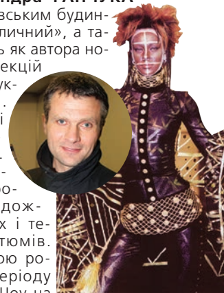
Гапчук О. Модель з колекції «Мала Африка», 2002 р. Репродукція / Канал колекції прет-а-порте, модельєрів прет-а-порте // Сезони моди, 2002, весна-літо. – С. 10.