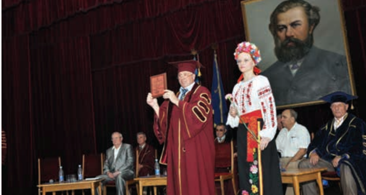
Урочисте засідання вченої ради Національного педагогічного університету імені М. П. Драгоманова. 24 червня 2010 р.

викладач, – неправильно». Я обурився, знову заходився рахувати, з'ясувалося, що його таки правда. Викладач засміявся, взяв заліковку й поставив «відмінно». «За що, я ж помилився?» «То дрібниці, – відказав він, – головне, що ти знаєш метод, знаєш суть». А під час тестування така ситуація не повторилася б. І найголовніше: ми розриваємо суб'єктні зв'язки між учителем і учнем. Ми не довіряємо вчителю. І це – неправильно.