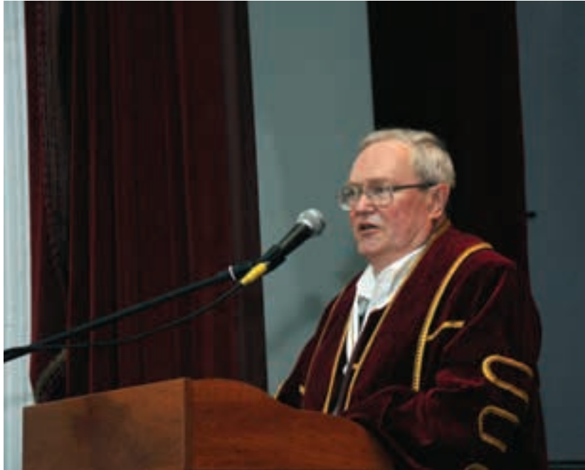
Мантию та диплом Почесного доктора Національного педагогічного університету імені М. П. Драгоманова вручено академіку Миколі Михальченку. 24 червня 2010 р.

— Система тестування потрібна. Однак не така, яка запроваджена нині. Вона має використовуватися разом з іншими системами оцінювання знань. Діти із сіл їдуть до обласних центрів складати тести. У якому стані вони туди приїдуть, де вони переночують? Про це ніхто