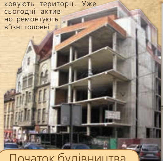
Початок будівництва вул. Франка

Євро-2012 – головний чинник для виходу Львова з будівельного застою. Окрім нових проспектів, у місті прокладають нові комунікації, нові очисні споруди, упорядковують території. Уже сьогодні активно ремонтують в'їзні головні