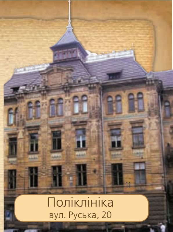
Поліклініка вул. Руська, 20

ського уряду він одержав замовлення на будівництво оперного театру в результаті конкурентної боротьби з відомим віденським бюро «Г. Гельмера і Ф. Фельнера», які споруджували театри в Європі.