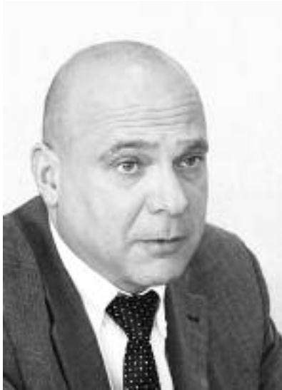
Олександр КОПИЛЕНКО, член-кореспондент НАН України