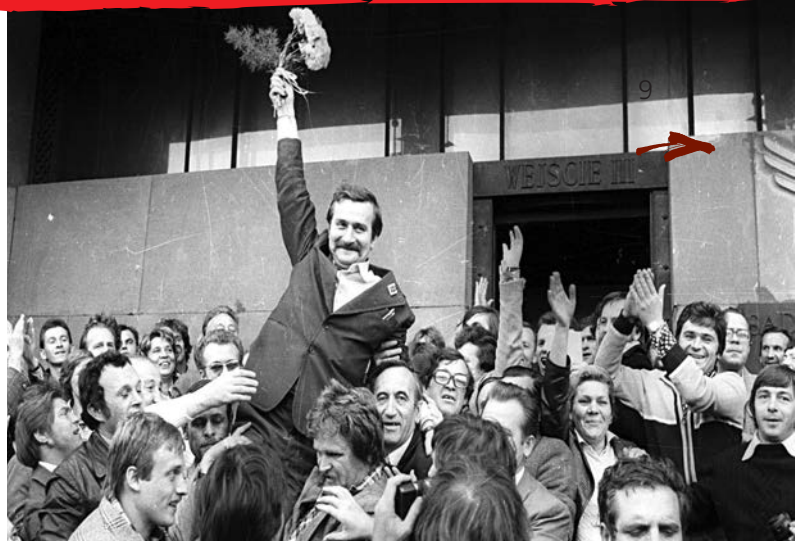
Радість після реєстрації «Солідарності» – Лех Валенса з квітами

була зрозуміла: не допустити, щоб поляки піддалися комуністичній пропаганді, щоб прийняли фальшивий образ польської історії. Ми хотіли бути ментально готовими до створення незалежного суспільства в тодішніх умовах, а також у тих, що можуть виникнути. І ще одне: від нас залежало, щоб поляки обрали добру методику розбудови незалеж-