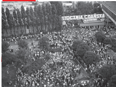
Страйк у Гданську 1980 р.

17 вересня 1980 року представники профспілкових структур, що створювалися по всій країні, зібралися у Гданську, щоб визначити долю нового руху. Вирішено створити єдину централізовану організацію, що базуватиметься на не типовому для професійних рухів територіальному принципі, що відтворював адміністративний поділ країни. Тимчасове керівництво нею взяла на себе Державна комісія з порозуміння, що складалася з представників регіонів на чолі з Лехом Валенсою. Після довгих перемовин комуністичний уряд Польщі мусив погодитися із існуванням незалежних профспілок: 24 жовтня Воєводський суд у Варшаві зареєстрував Незалежну самоврядну професійну спілку (НСПС) «Солідарність». Однак дописав до її статуту фрагмент про визнання «керівної ролі Польської об'єднаної робітничої партії (ПОРП)» та викреслив передбачене в проекті статуту право на страйк.