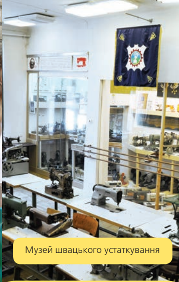
Музей швацького устаткування