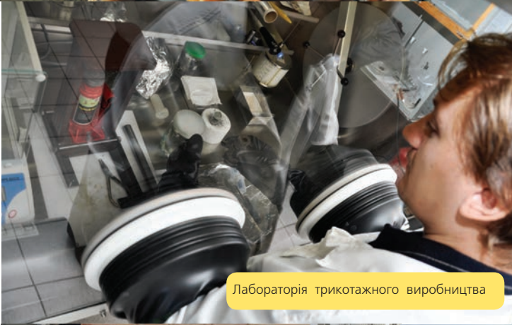
Лабораторія трикотажного виробництва