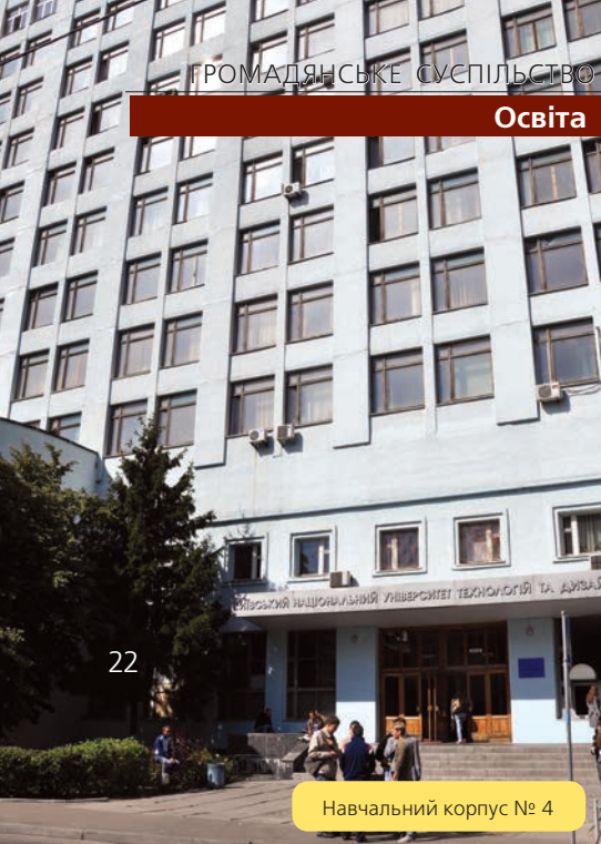
Навчальний корпус № 4

Ольга КРАСОВСЬКА