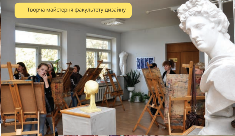
Творча майстерня факультету дизайну