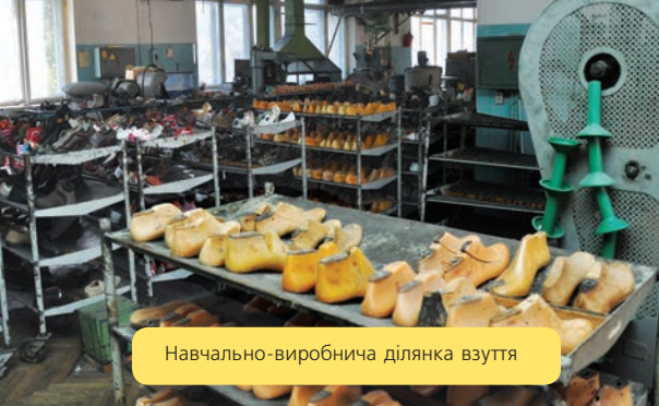
Навчально-виробнича ділянка взуття