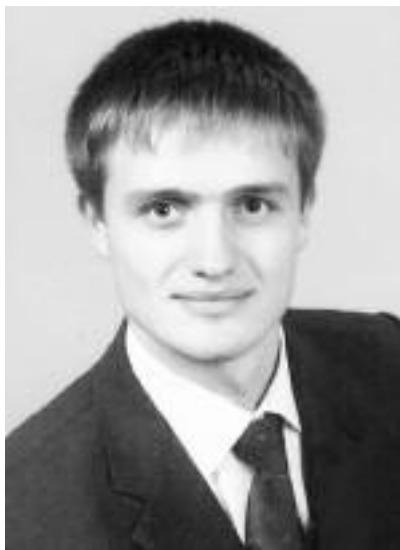
Сергій СТАСЮК, помічник судді Верховного Суду України