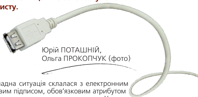
Юрій ПОТАШНИЙ

До професійного свята, яке відзначають 24 грудня, електронний архів додатково отримає п'ять великих кімнат. Це тимчасове розв'язання проблеми, адже установа потребує набагато більших площ для зберігання електронної спадщини країни, а для забезпечення доступу до неї – читальних залів. Усе це архівісти мають отримати наступного літа, коли буде здано в експлуатацію комплекс архівних споруд.