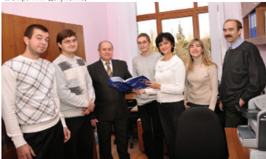
У колективі ЦДЕА переважає молодь