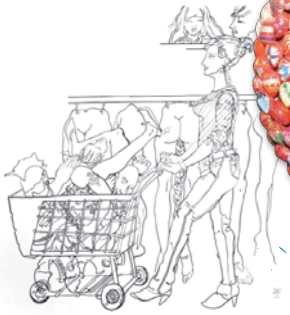
Ольга КЛЕЙМЕНОВА