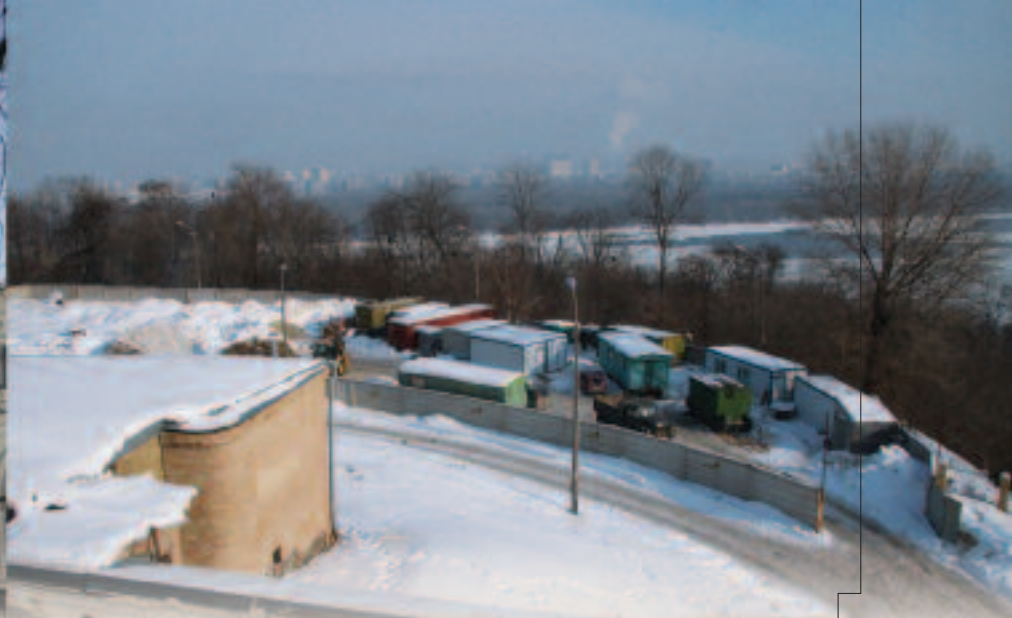
Незабаром Києво-Печерська лавра приросте п'ятизірковими «келіями» для вболівальників Євро-2012