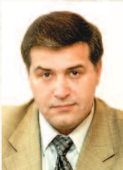
Юрій ШАЙГОРОДСЬКИЙ, президент Українського центру політичного менеджменту, доктор політичних наук