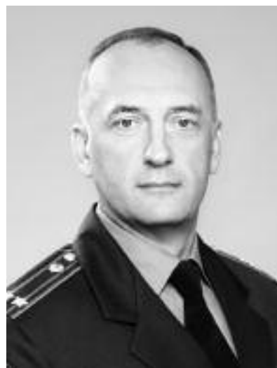
Юрій МАРТИНЕНКО, заступник начальника служби внутрішньої безпеки головного управління боротьби з організованою злочинністю МВС України, заслужений юрист України