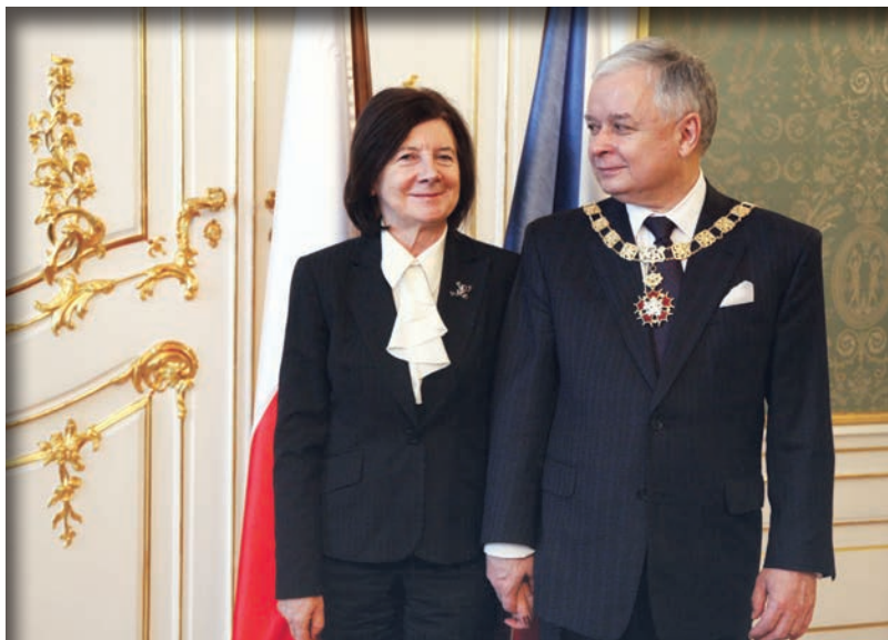
Під час офіційного візиту до Чехії

їхні стосунки не є результатом режисури... а те, що на людях поправляє йому краватки, випливає з її автентичної турботи. Це просто партнерське, любляче одне одного подружжя».