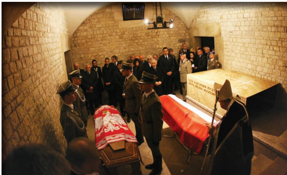
Подружжя Качинських поховали в крипті під Вежею срібних дзвонів Вавельського замку

Попри складні ситуації й випробування, які неодноразово ставила перед ними доля, Лех і Марія Качинські прожили, за