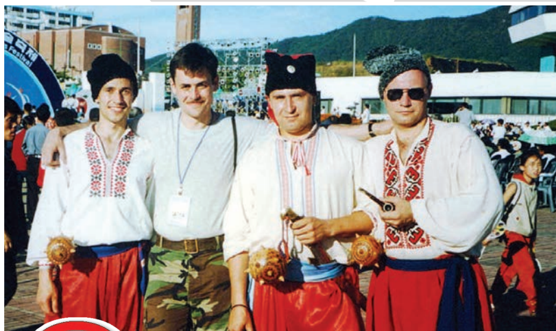
На фестивалі бойових мистецтв у Південній Кореї

І так було майже щодня протягом усіх трьох років навчання в академії. Крім фізичного вдосконалення за методиками ніндзюцу, офіцер вивчав історію та психотехніку цього унікального бойового мистецтва.