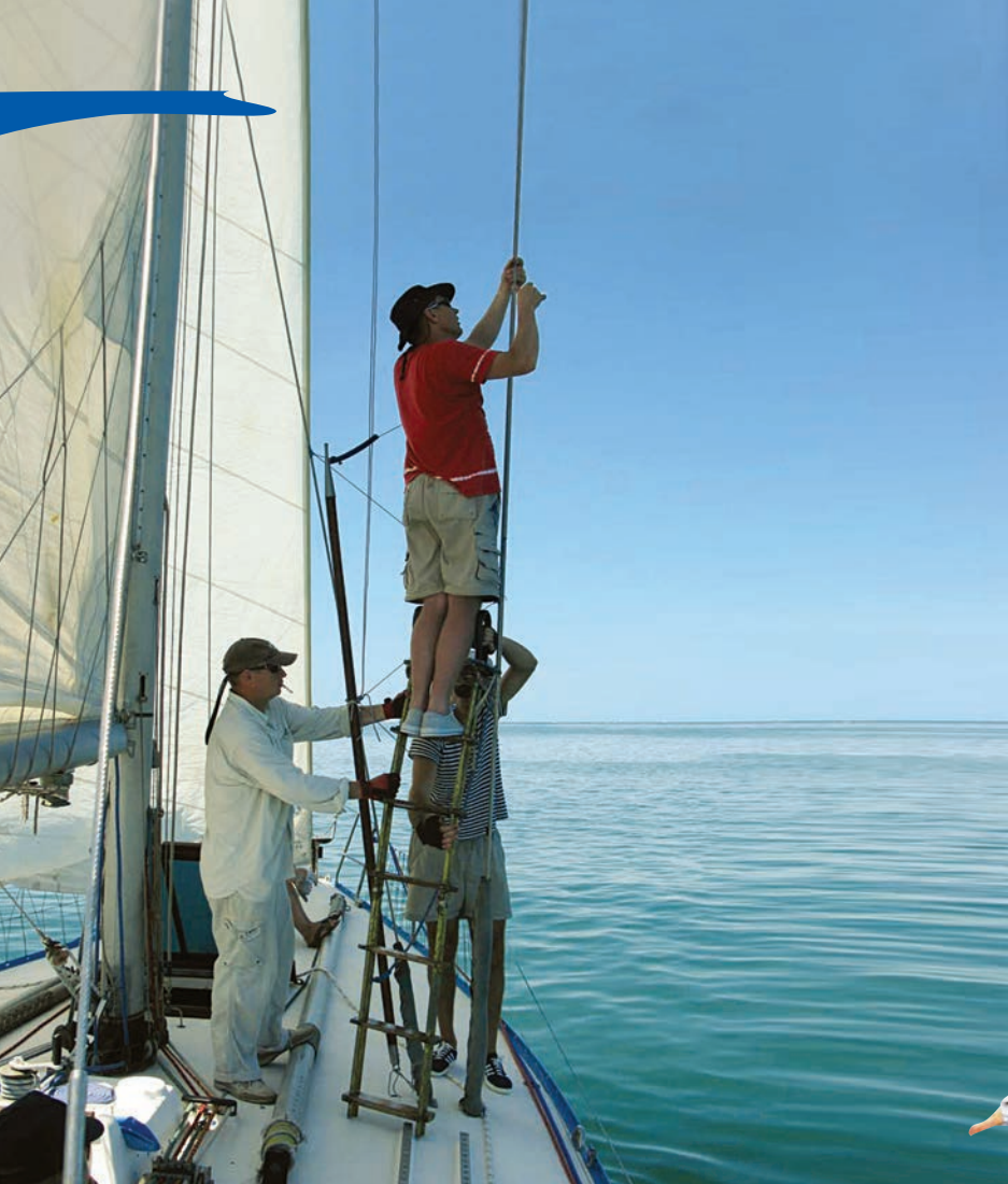
Яхта «Гермес» готується до старту