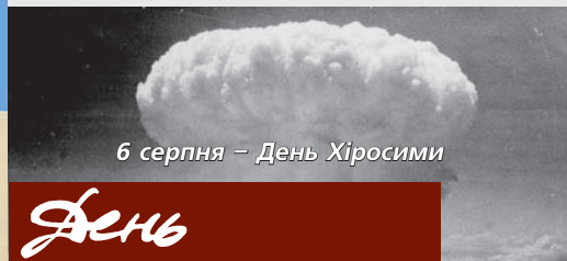
6 серпня – День Хіросіми