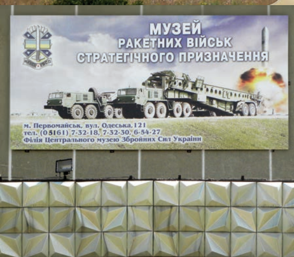
Легендарна РС-20В (за натовською термінологією – SS-18 «Сатана»)