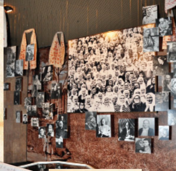
Фотографія в центрі – колективний портрет 268 вдів із села Мельників Чорнобаївського району Черкаської області. Фото зроблено 1985 року. Довкола – портрети вдів із інших регіонів України.