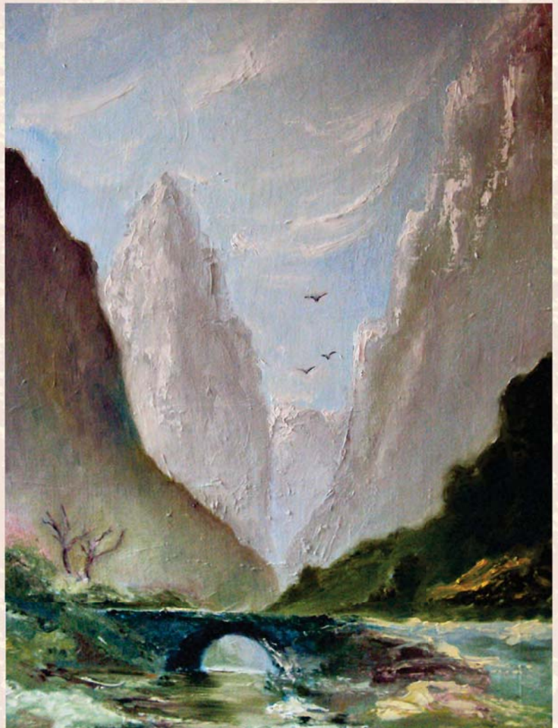
«Кавказ». Полотно, олія. 60 x 80 см.

Тож, видається, творчі пошуки Юлії Невгад відбуваються в одвічній і довічній царині справжнього мистецтва, котру вона віднаходить у собі, у своєму жіночому й мистецькому призначенні, в кольорах, які ллються на її полотна із сонячних небес, нагадуючи іншим людям, що світ – прекрасний і залишиться таким і після нас, принаймні у наших найсвітліших помыслах і полотнах його сонячних співців.