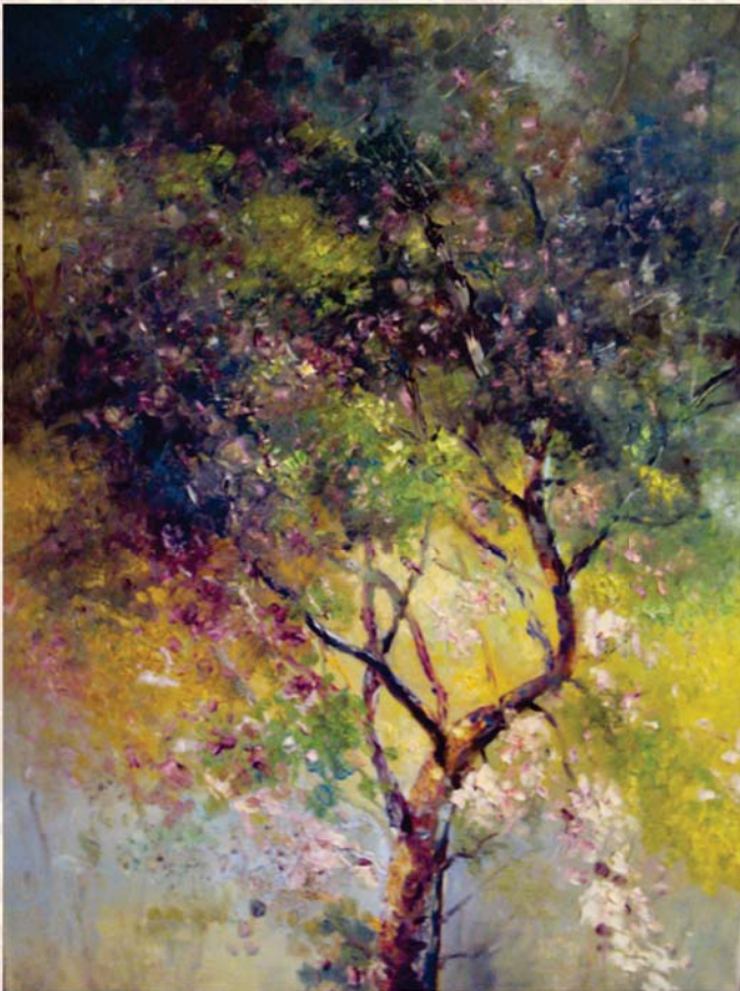
«Весняний сад». Полотно, олія. 50 x 70 см.