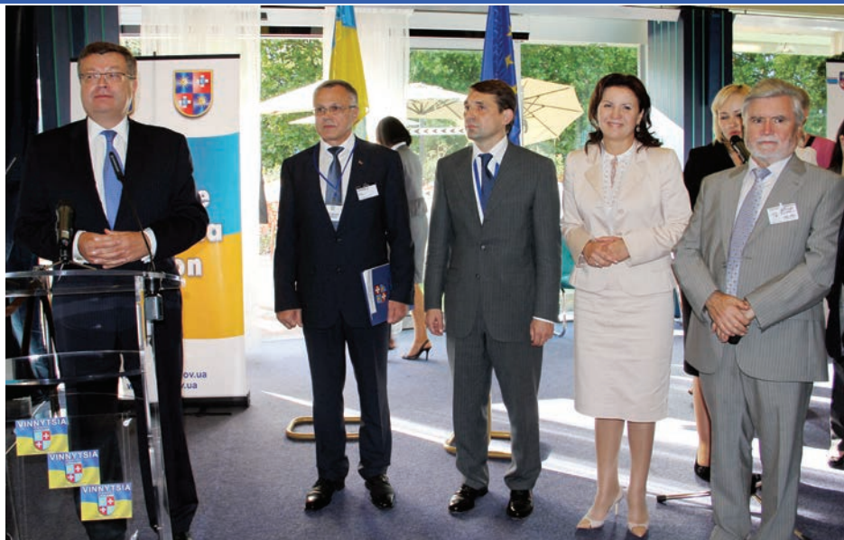
Презентацію Вінниччини в Раді Європи у Страсбурзі відкрив Міністр закордонних справ України Костянтин Грищенко (ліворуч)

У Берні, Страсбурзі та Брюсселі керівник делегації, голова облради Сергій Татусяк провів півгодинну слайд-презентацію Вінницької області: від її географічного розташування до конкретних бізнес-проектів. Учасники презентації відзначили практичність заходу, який, за словами євровичовників, є основою для двосторонньої співпраці. Серед запрошених у будинку Ради Європи в Страсбурзі були 80 послів та представників дипломатичних відомств різних країн, бізнесмени, члени громадських організацій. Міністр закордонних справ України Костянтин Грищенко подякував вінничанам за професійно організований захід, закликав європейських колег «сприй-