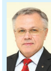
Сергій ТАТУСЯК, голова Вінницької облради:

– Одне із завдань нашої презентації – знайти партнерів обласній раді, територіальним громадам і громадським організаціям, а бізнесу – інвесторів. Ставили за мету ознайомитися з інституціями Ради Європи та Європарламенту, з європейськими фондами, новаціями у країнах євроспільноти. Тоді простіше налагоджувати вирішення найбільш важливих питань через проекти, зокрема в рамках програми «Східне партнерство». Наш приїзд – це ще один сигнал для європейців про те, що ми готові до співпраці з країнами ЄС на всіх рівнях – від місцевого до державного.