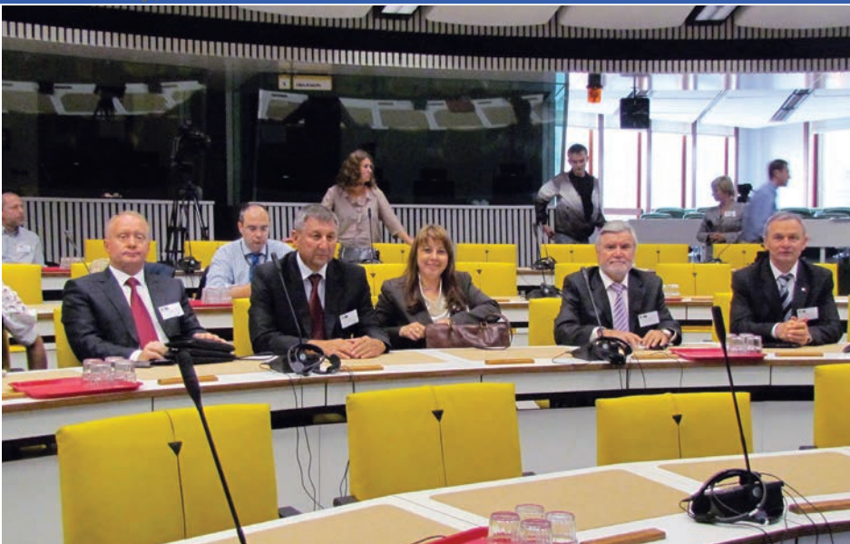
Члени вінницької делегації під час засідання «круглого столу» в Комітеті регіонів Євросоюзу в Брюсселі

природні ресурси. Набагато важливішим є спілкування за принципом: люди – до людей. Європейці не до кінця розуміють наш менталітет. Цьому перешкоджають стереотипи минулого. Треба показувати їм, що ми вже інші, ніж були за часів тоталітарної держави.