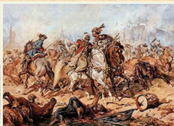
М. Альтомонте. «Битва під Парканами»