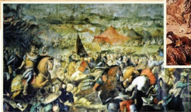
М. Альтомонте. «Битва під Віднем»