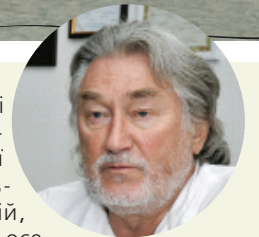
Андрій ЧЕБИКІН, президент Академії мистецтв України, академік.

Як вища науково-творча установа в галузі професійного мистецтва, Академія об'єднує творчі, наукові, педагогічні сили України для розв'язання гуманітарних проблем і втілення в життя завдань розвитку національної культури і мистецтва».