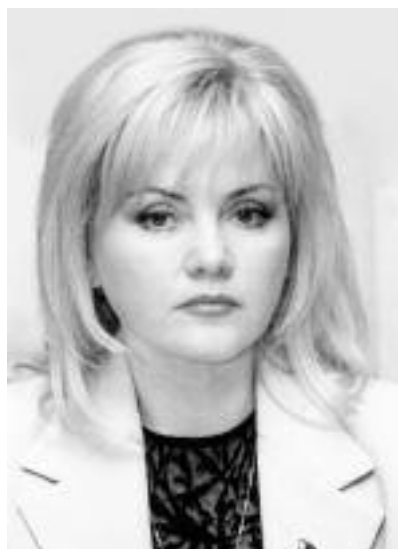
Оксана БІЛОЗІР, народний депутат України