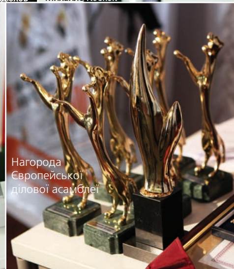
Нагорода Європейської ділової асамблеї