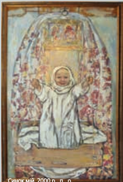
Синок мій. 2000 р., п., о.