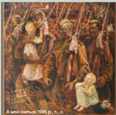
А мені сниться. 1985 р., п., о.