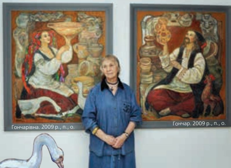
Гончарівна. 2009 р., п., о.