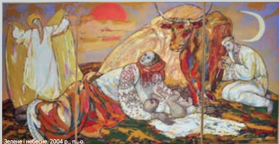
Зелене і небесне. 2004 р., п., о.