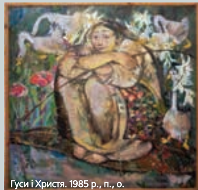
Гуси і Христя. 1985 р., п., о.