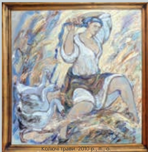
Колючі трави. 2010 р., п., о.