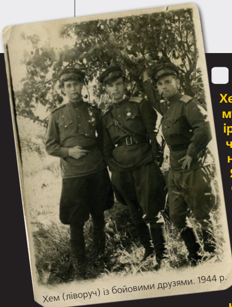
Хем (ліворуч) із бойовими друзями. 1944 р.

Хем курить трубку, але на Хемінгуея не такий уже й схожий. Хіба що – мудрістю від пережитого в примружених очах, якої не камуфлюють навіть іронічні бісики. Хіба що – пристрастю до слова. А ще – аналогічною віхою часів Другої світової: й американський письменник, і герой цього матеріалу на літаках бомбардувальної авіації нищили фашистів.