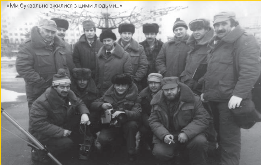
«Ми буквально зжилися з цими людьми...»