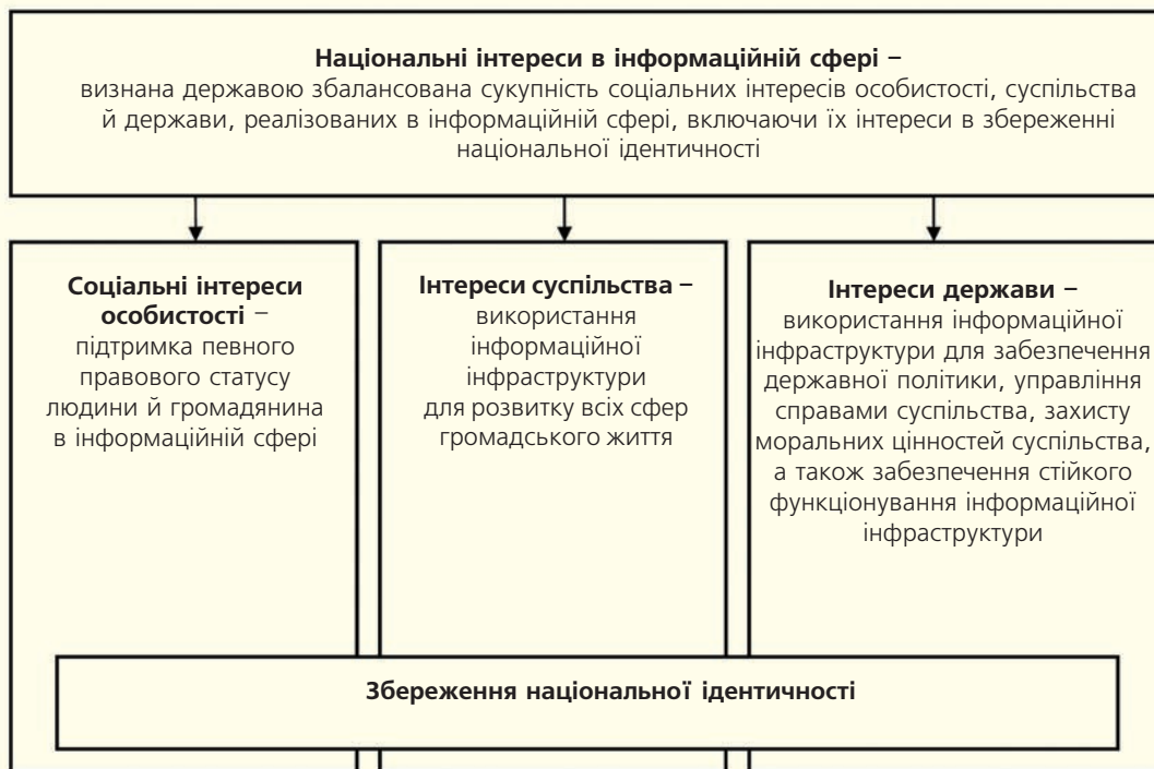
Рис. Структура поняття «національні інтереси в інформаційній сфері»

держави щодо одержання, використання, поширення та зберігання інформації» [1]. Воно, на жаль, недостатньо ємне, а тому в нас постійно є гостра потреба досконалішого визначення інформаційної політики й вивчення досвіду інших країн, повніше визначити її як політику, що встановлює порядок збирання, створення, організації, доступу та поширення інформації і, отже, точніше визначити: хто може користуватися тією чи іншою інформацією, чи повинна бути і в якому розмірі платня за доступ і користування інформацією.