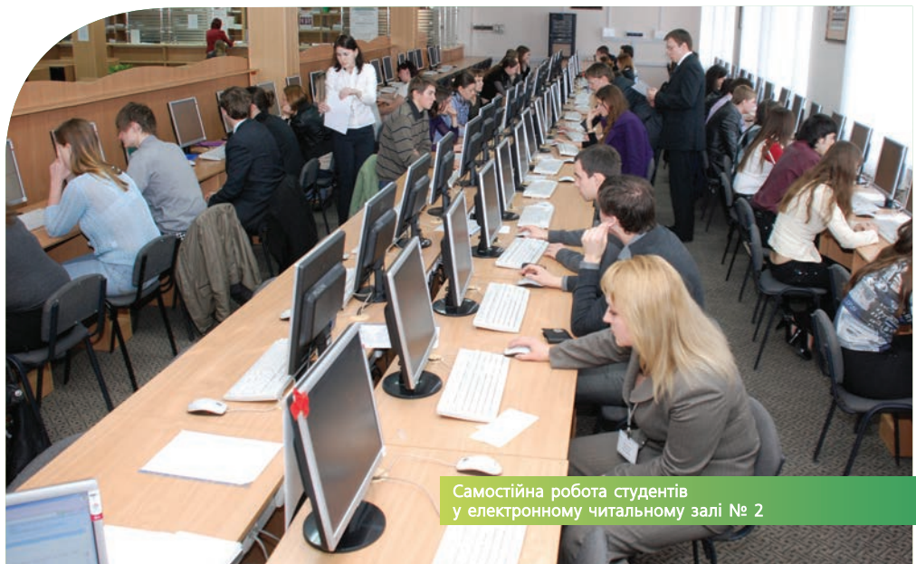
Самостійна робота студентів у електронному читальному залі № 2

Зрозуміло, досягнення навчального закладу, які неодноразово відзначалися присвоєнням йому звання «Лідер сучасної освіти» та врученням срібних і золотих медалей Міністерства освіти і науки та Національної академії педагогічних наук України, – це результат невтомної праці понад 60 докторів наук, професорів і 270 кандидатів наук, доцентів, котрі становлять основну частину професорсько-викладацького складу 30 кафедр університету.