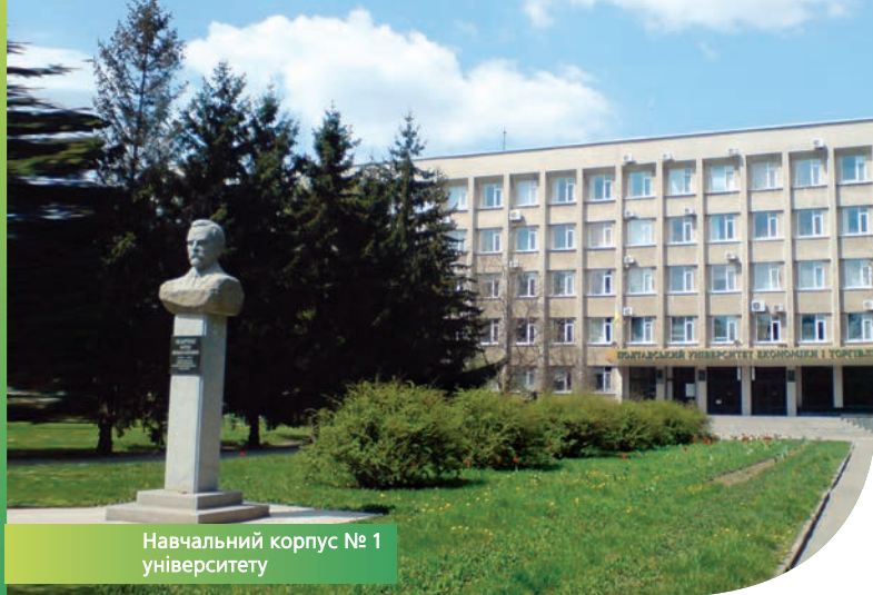
Навчальний корпус № 1 університету