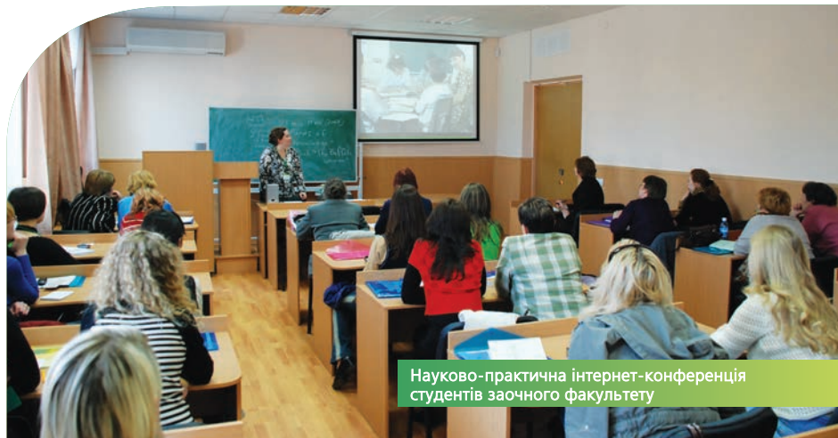
Науково-практична інтернет-конференція студентів заочного факультету

Іншим досягненням ВНЗ, що дає йому змогу успішно виконувати суспільну місію, є одне з найкращих в Україні інформаційне та кадрове забезпечення навчального процесу й наукових досліджень. Наведу кілька цифр для ілюстрації цих досягнень: сьогодні локальна мережа університету, протяжність якої становить вже понад 60 км, об'єднує 35 комп'ютерних класів з 875 ПЕОЕМ, три електронні читальні зали з 160 ПЕОМ, 17 мультимедійних лекційних аудиторій і ще 370 комп'ютеризованих робочих місць у комп'ютерних класах, що в другій